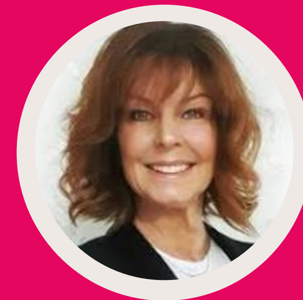
CINA | CHAIR

Ansvarar för kvalitetssäkring och efterlevnad av regelverk, med specialisering inom MedTech-standarder.